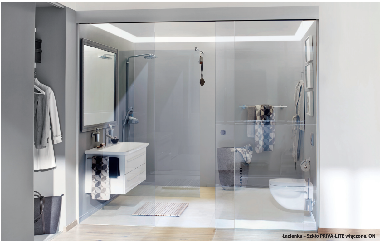
Łazienka – Szkło PRIVA-LITE włączone, ON