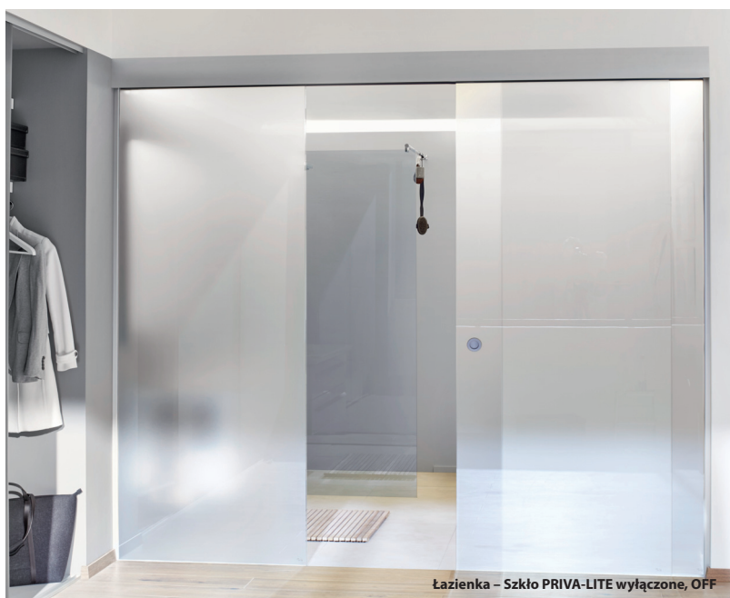
Łazienka – Szkło PRIVA-LITE wyłączone, OFF

Dzięki zastosowaniu kolorowych wariantów folii w PRIVA-LITE COLOR, użytkownik zyskuje szeroką gamę barw i duże możliwości aranżacyjne. PRIVA-LITE TEXGLASS to linia dekoracyjnego szkła laminowanego wypełnionego